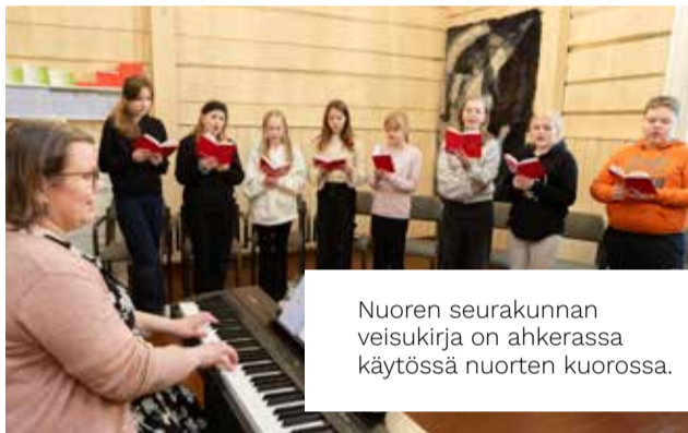
Nuoren seurakunnan veisukirja on ahkerassa käytössä nuorten kuorossa.

Maaningalla on innokkaita ja hienoäänisiä nuoria kuorolaisia, joilla löytyy yhteinen sävel.