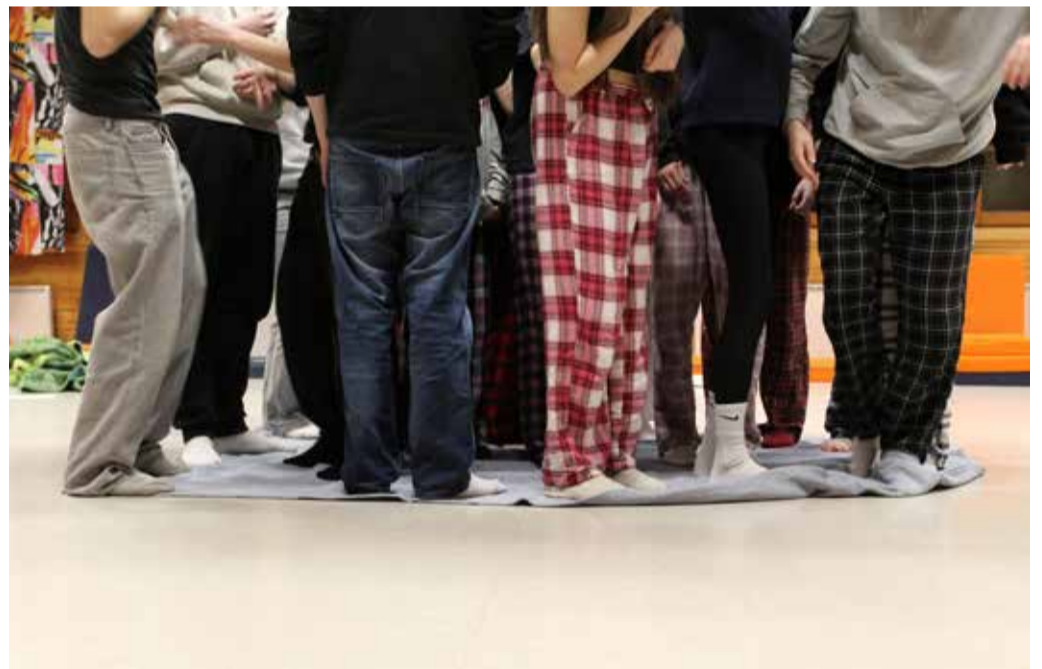
Kasvattavaa, opettavaa, hyödyllistä ja hauskaa! Ryhmähenki oli hyvä Hirvijärven 1. vuoden isosleirillä tammi-helmikuun vaihteessa.