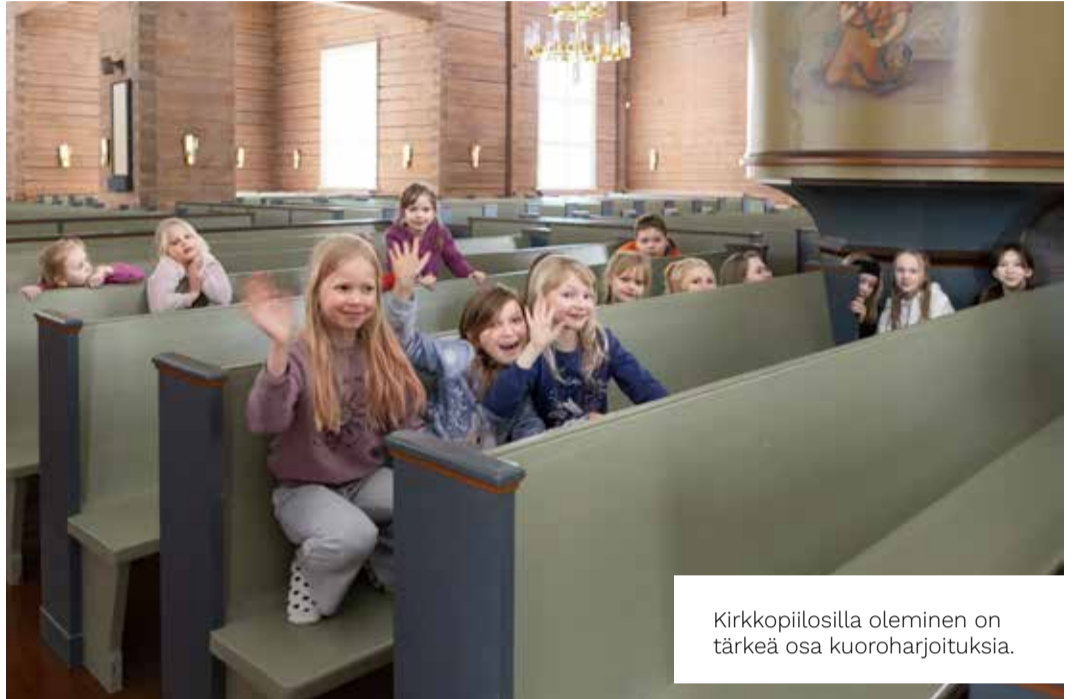
Kirkkopiilosilla oleminen on tärkeä osa kuoroharjoituksia.