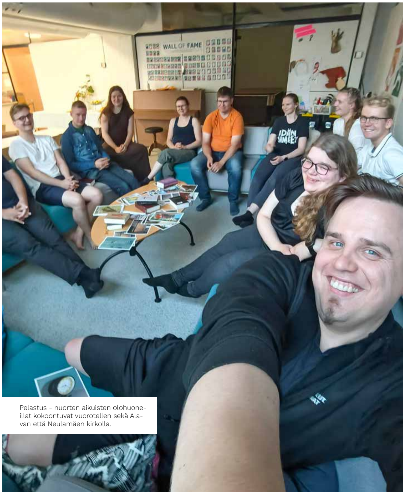
Pelastus - nuorten aikuisten olohuone- illat kokoontuvat vuorotellen sekä Alavan että Neulamäen kirkolla.

Miesporukka on kokenut tärkeäksi myös rukouksen.